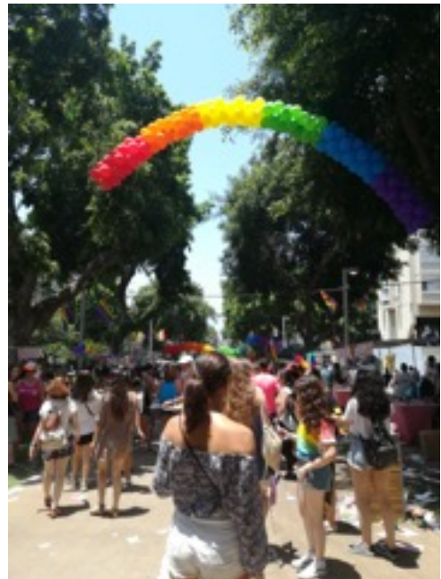
Gay Pride Tel Aviv 2018

Die Einwohner Israels sind meist sehr offene Menschen. Dies war in manchen Situationen etwas unangenehm, da ich doch eher die zurückhaltende Art der Deutschen gewohnt bin, aber schnell habe ich die offene, herzliche Art der Israelis lieb gewonnen. Als ich am Anfang an einer Bushaltestelle stand und etwas verzweifelt dreinblickte, kam direkt eine ältere Frau auf mich zu und wollte mir helfen. Da ich noch kein Wort Hebräisch konnte und sie somit nicht verstand, schaltete sich eine jüngere Dame dazu und half auf Englisch weiter. Israelis fangen schnell ein Gespräch an, helfen bereitwillig, tauschen gern die Nummern aus oder laden einen zum Essen ein. Selbst als ich zum Arzt musste und nicht mehr viel Geld hatte, bot mir eine Frau, die mich wenig kannte, direkt an, dass sie mir etwas leihen würde. Allgemein wird vieles in Israel lockerer gesehen, was aber auch von Nachteil sein kann. Zum Beispiel mussten wir, als der Kühlschrank in der WG kaputt ging 1,5 Monate auf einen neuen warten. Das war einer der Momente, in denen ich die deutsche Ordnung vermisst habe. Ebenso erging es mir beim Straßenverkehr. Es wird wegen jeder Kleinigkeit gehupt, selbst wenn nichts ist. Und die Fahrweise ist manchmal etwas riskant. Aber zum Glück habe ich auch das überlebt. Insgesamt finde ich, dass sich die Deutschen etwas von dieser offenen und lockeren Art der Israelis abschneiden könnten und die Israelis etwas von der Disziplin und Ordnung der Deutschen.