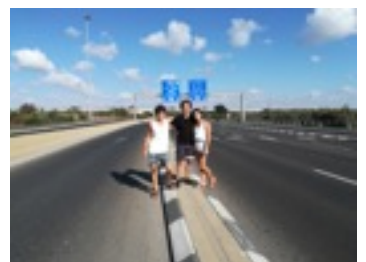
Jom Kippur 2017

Diese zu erleben, war etwas ganz besonderes. Ein Tag, der sich mir sehr eingepägt hat, war Jom Kippur („Tag der Sühne“), einer der wichtigsten jüdischen Feiertage. An dem Tag wird geruht, das heißt es fahren keine Busse, keine Autos. Alles bleibt zu. Selbst der Flughafen ist für diese Zeit ausser Betrieb! Meine Mitbewohner und ich sind zu Fuß über die Autobahn zum Strand gelaufen und es war komplett leer.